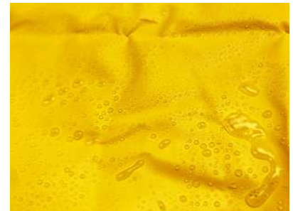
Material Proquinal 100% impermeable