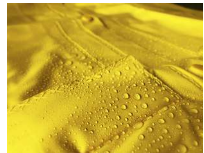
Uniones eléctro selladas y reforzadas para mayor durabilidad